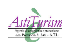
A.T.L. Asti Turismo